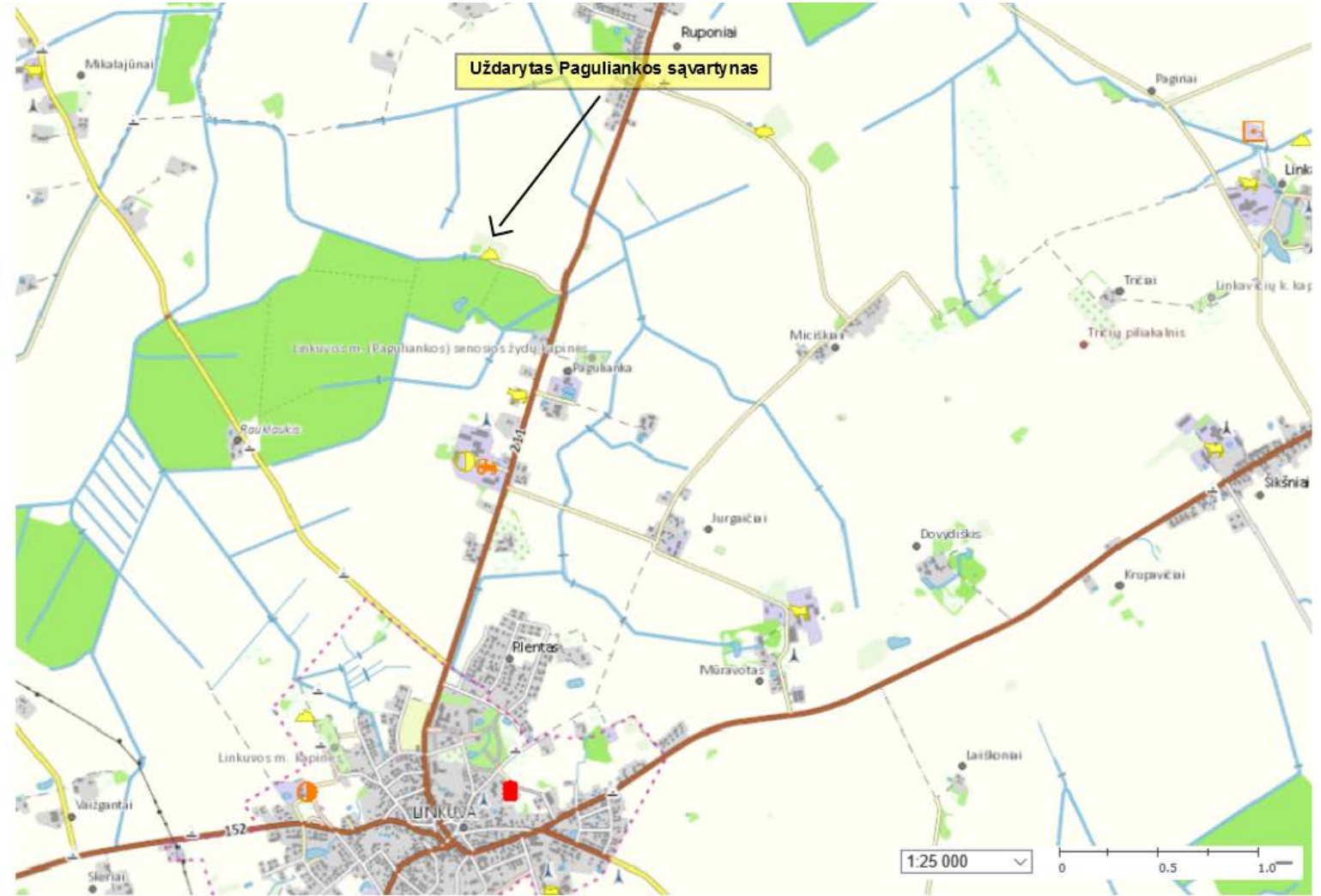
2 pav. Uždaryto Paguliankos sąvartyno apylinkėse esantys potencialūs taršos šaltiniai