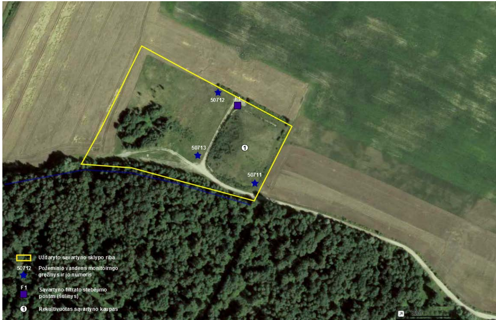
3 pav. Uždaryto Paguliankos sąvartyno teritorijos eksplikacija su aplinkos monitoringo postų išdėstymu